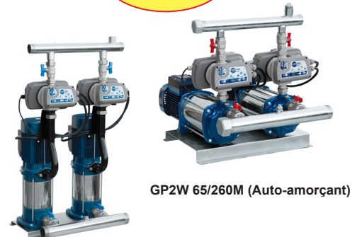
GP2W 70/360M & 65/240M