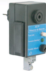
ASTP + RM