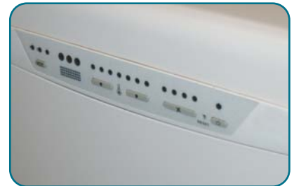
Platine de commande

ATTENTION : percer les trous diamètre 155 avec une légère inclinaison, afin de prévenir tout retour d'eau par les tubes.