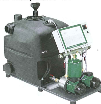
Wilo-Rainsystem AF 400

Système hybride pour la récupération de l'eau de pluie industrielle et commerciale destinée à économiser l'eau potable grâce à des citernes ou réservoirs. Avec réservoir de 400L et 2 pompes auto-amorçantes