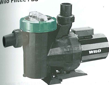
Wilo Filtec FBS

Circulation de l'eau de piscine selon DIN 19643, partie 1 à 5 avec filtre incorporé.