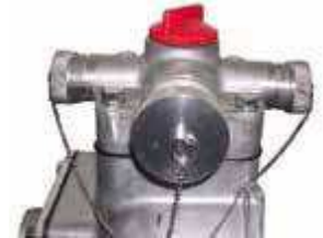
Détail des 3 sorties au refoulement

(HA) Modèles équipés d'une sécurité manque d'huile.