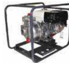
TEW2 50 HA