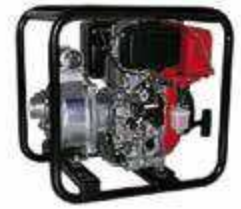
TEF3 50 RD