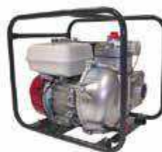
TEF3 50 HA