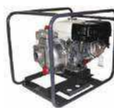
TEW2 50 HA