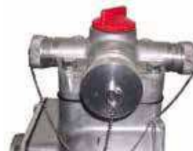
Détail des 3 sorties au refoulement

(HA) Modèles équipés d'une sécurité manque d'huile.