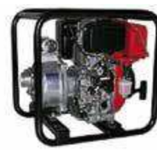
TEF3 50 RD