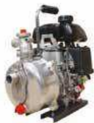
TEF 25 HA