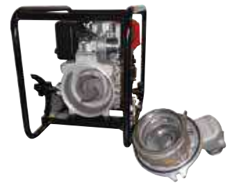
(HA) Modèles équipés d'une sécurité manque d'huile.