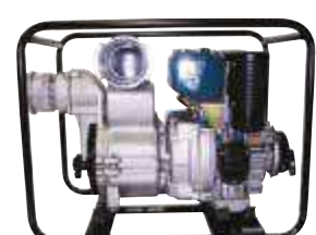
TED 100 RD