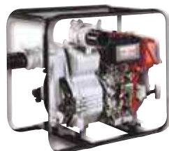
TED 50 RD