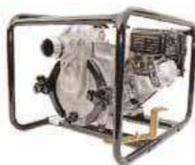
TED2 50 HA