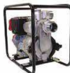
TED 80 RD