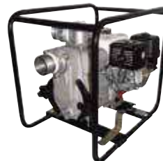
TED2 80 HA