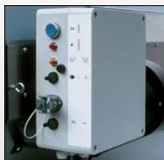
Panneau de contrôle à l'épreuve de l'humidité et de la poussière AGA 45 E/75 E