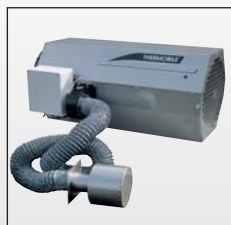
Aspiration de l'air extérieur avec abergement mural pour AGA 45/75/102/111E.

Brûleur propre grâce à la prise d'air extérieure. Ventilateur pour air de combustion plus pur.