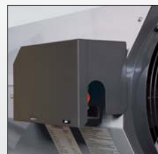
En option: Capot de protection pour AGA 45E et AGA 75E.