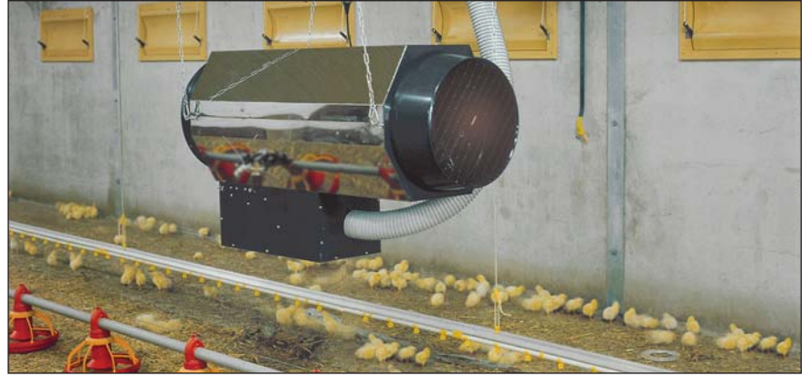
Système modulant pour AGA 102 E.