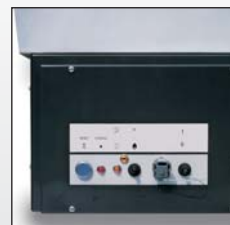
Panneau de contrôle à l'épreuve de l'humidité et de la poussière. AGA 100 E/102 E/111 E