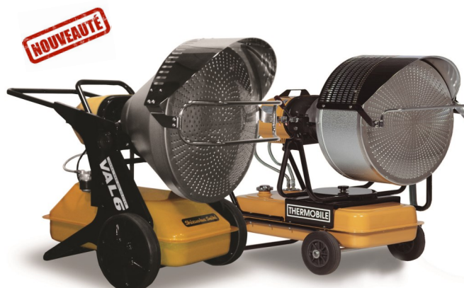
VAL 6 EPX