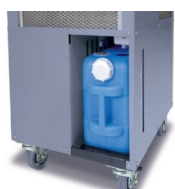
Bac de récupération des condensats