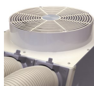
Sortie d'air chaud