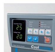
Minuteur et thermostat d'ambiance digital