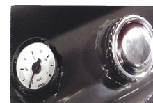
Détail indicateur de la jauge