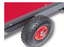
Roues gonflables de série sur TA 22 P En option pour autres modèles