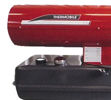
TA 40 et TA 80 sont équipés d'une jauge de série