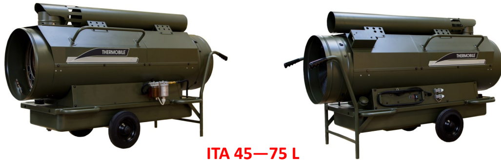
ITA 45—75 L

L'ITA-L est un appareil de chauffage d'abris, robuste et compact, destiné aux organisations civiles et militaires qui opèrent dans des zones et conditions difficiles. Il est utilisé par les militaires lors de missions humanitaires et de sauvetage, pour chauffer les tentes et les hôpitaux de campagne. L'ITA-L est livré complet, avec thermostat, cheminée et possibilité de gaines de soufflage et de recirculation.