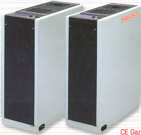
CE Gaz 51AT460