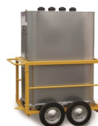
Kit pompe électrique