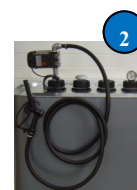
Kit pompe élec-