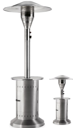
CALIPSO INOX PRO*