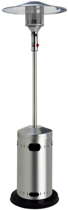
CALIPSO INOX CLASSIQUE (existe en version rétractable)