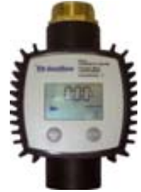
Volucompteur (en option)