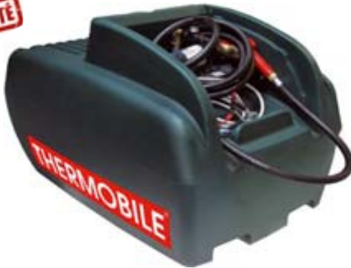
Version sans couvercle