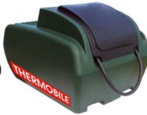
Version avec couvercle (en option)