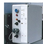
Panneau de contrôle à l'épreuve de l'humidité et de la poussière Pour AGA 45 E / 75 E