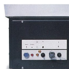
Panneau de contrôle à l'épreuve de l'humidité et de la poussière Pour AGA 111 E