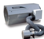
Aspiration de l'air extérieur avec ébergement mural pour AGA 45/75/111 E