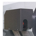
En option : capot de protection pour AGA 45 E / 75 E