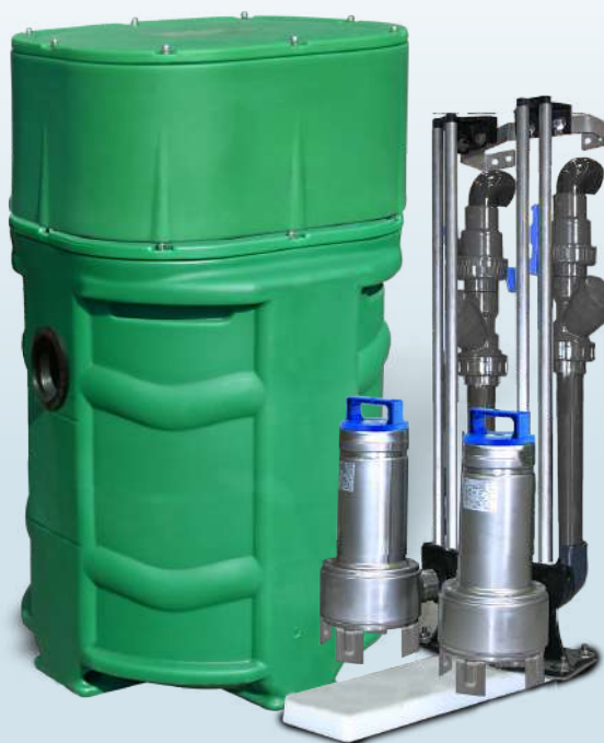
SANIREL 250 2 POMPES BARRES DE GUIDAGE