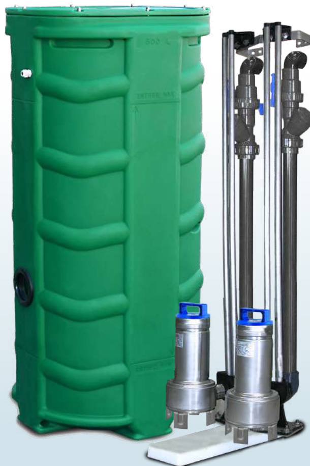
SANIREL 500V 2 POMPES BARRES DE GUIDAGE