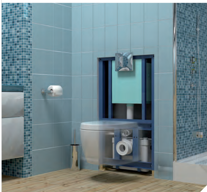
Refoulements vertical et horizontal : ↑ 5 m → 100 m

* Le Saniwall Pro a reçu le label AFISB BIEN VIVRE certifiant que c'est un produit de qualité destiné à apporter un confort optimal aux personnes à mobilité réduite.