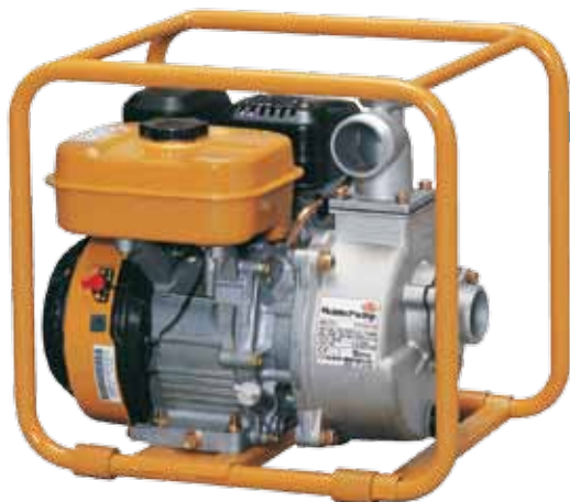
TH 45 EX

Super trash, Gasoline / Sehr zähflüssiges Wasser, Benzin