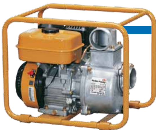
TH 63 EX