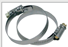
Collier de serrage Ø25-40 386062 Collier de serrage Ø32-50 369040