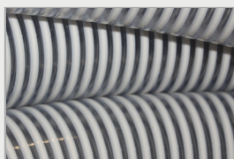
Tuyau Ø32 100926 pour 111169 Tuyau Ø40 100938 pour 110807 Tuyau Ø50 100947 pour 980011