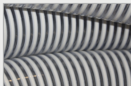
Tuyau Ø30 100920