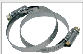
Collier de serrage Ø25-40 386062