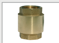
Clapet anti-retour 1"1/4 369119