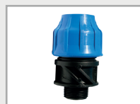
Raccord compression 1"1/4 x40 369302