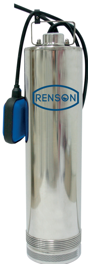
Codes 106076 - 106075