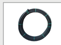
Tuyau Ø40 100841