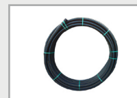
Tuyau Ø40 100841