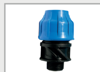
Raccord compression 1"1/4 x40 369302