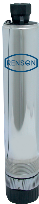
Codes 110786 - 110785