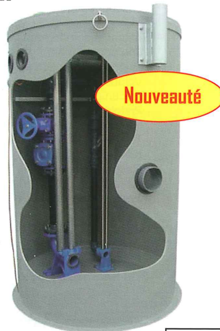
Exemple d'équipements internes