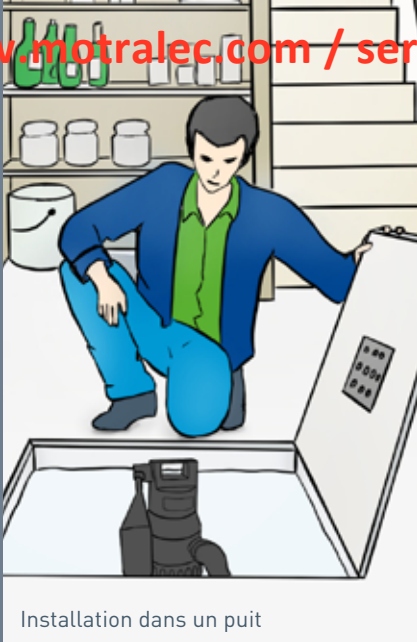
Installation dans un puit