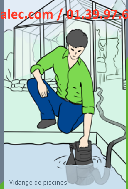
Vidange de piscines