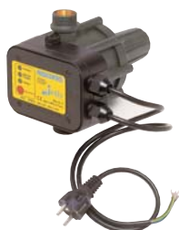
PRESSCONTROL pour puissance jusqu'à 1,5 kW