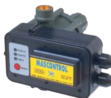
MASCONTROL pour puissance jusqu'à 2,2 kW