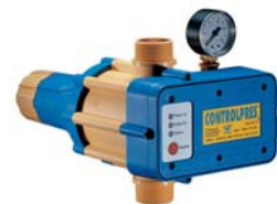
CONTROLPRES pour puissance jusqu'à 2,2 kW. Régulation de la pression de sortie entre 3 et 6,5 bars.