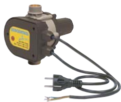
ECOCONTROL pour puissance jusqu'à 1,1 kW