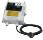
Coffret de démarrage pour pompes monophasées (livré avec la pompe)