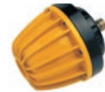
Kit press 1/4"