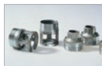
Corps de refoulement et accouplement moteur-pompe en acier inoxydable