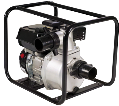
GP 50 / GP 80