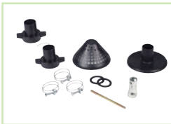
Accessoires livrés avec GP10