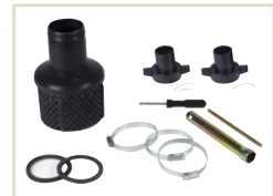
Accessoires livrés avec GP50 / GP80