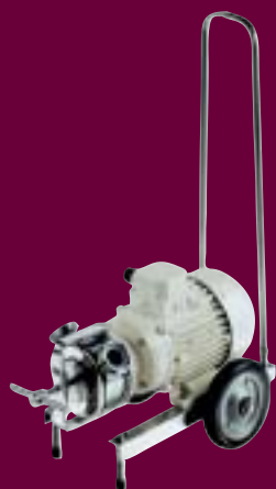
Série R- M

Ces pompes sont destinées au transfert de liquides clairs, visqueux, fragiles, pouvant contenir des particules en suspension, tels que : vin, moûts, lies, cidre. Auto-amorçantes, réversibles et polyvalentes, elles assurent le pompage des liquides en douceur, sans émulsion. Le choix des matériaux n'altère en aucun cas les qualités organoleptiques des produits véhiculés (agrément 3A).