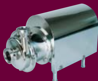
Série ICP +

Ces pompes centrifuges ont été spécialement développées pour répondre aux exigences des procédés de fabrication. Tous les composants en contact avec le liquide sont en acier inoxydable electro-poli pour éviter toute adhérence de produits et la finition irréprochable en surface offrent une grande nettoyabilité. Elles acceptent ainsi les particules en suspension et la présence de gaz grâce à leur hydraulique semi-ouverte. Leur excellent rendement hydraulique, associé à un très faible NPSH, permet de nombreuses possibilités d'utilisation.