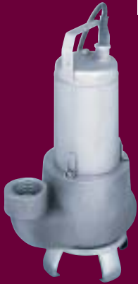
DELIXA GP 3051

Cette gamme est utilisée pour des capacités de pompage plus élevées, des eaux résiduaires ou de lavage. Elles peuvent être installées soit sur socle, soit sur pied d'assise fixé à demeure au fond du puisard. Elles sont équipées soit d'une roue vortex, soit d'une roue monocanale avec une section de passage élevée.