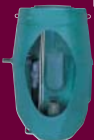
STATION MICRO TOP

Le fond de cuve (système TOP) autonettoyant permet d'éviter la décantation des matières solides. Construction modulaire et personnalisée pour s'adapter aux contraintes des installations.