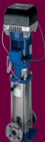
PRAXINOX équipée du Technovar

Elles sont destinées à augmenter la pression grâce aux hydrauliques multi étagées, d'un circuit d'eau des unités de filtration, des systèmes de nettoyage ou encore des circuits de refroidissement des cuves de fermentation.