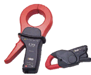
Pince MN20 P01.1204.40 Pince C172 P01.1203.10 Pince C176 P01.1203.30