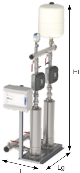
S20 EMT MPSU505